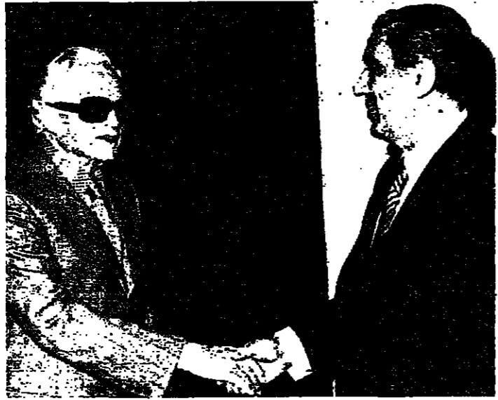
الرئيس سركيس لدى استقباله الرئيس شمعون في قصر بعبدا أمس